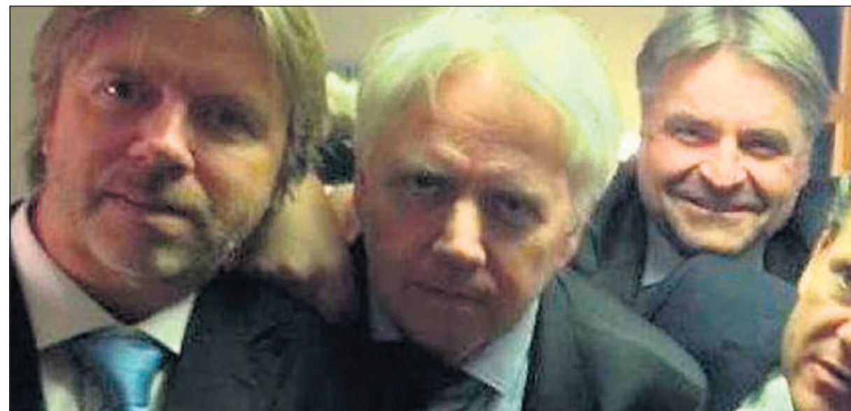
DE SYV HERRENE I «GLIMMER TWINS». Bandet består av menn i høye stillinger, som sammen finner frem til løsninger.