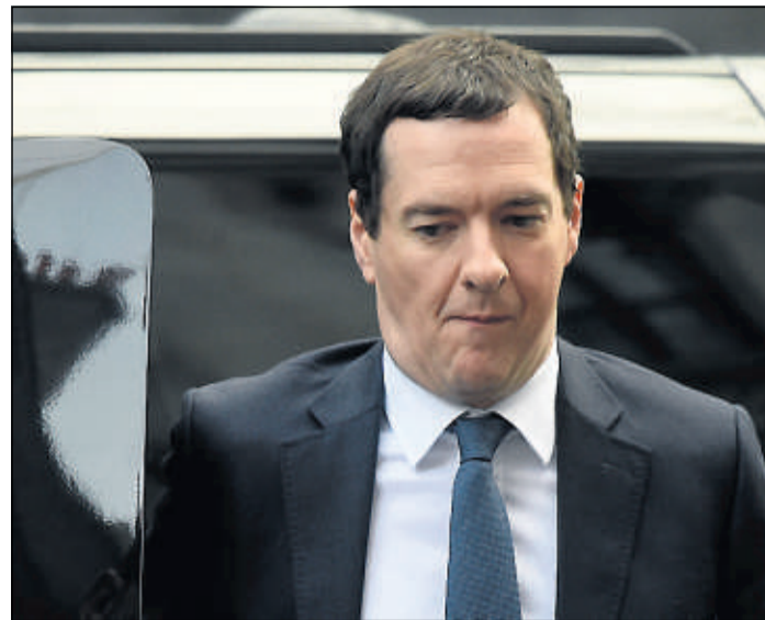
TAKK. Storbritannias finansminister takkes i rulleteksten i den siste Star Wars-filmen. Det kan skape trøbbel for både britene og Disney.