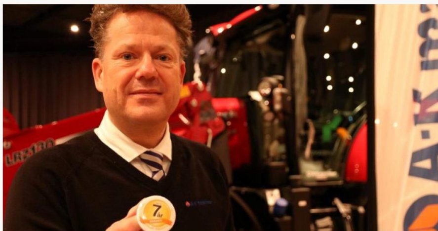
A-K maskiner og Erik Grefberg kan nå tilby en service- og garantiordning som strekker seg over sju år.

A-K skal selge flere traktorer på bedre forsikringsordning.